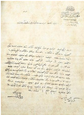
Təhsil nazirinin Köprülüzadəyə göndərdiyi rəsmi məktub

qurulması nəzərdə tutulan bu institutun rəmzini əlində məşəl tutan bir bozqud olmasını istəyən Atatürk, eyni zamanda bu yeni elm ocağının beynəlxalq miqyasda Türkoloji toplantıları keçirməsini də arzulamışdır.