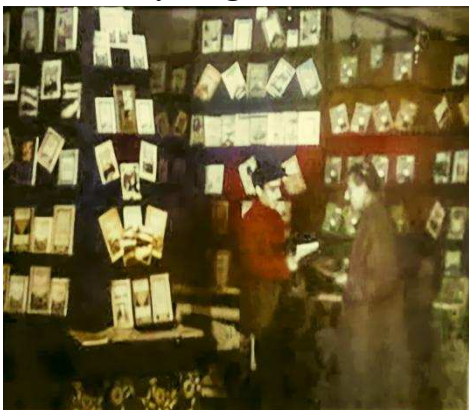
İsmailiyyə sarayında açılmış nəşriyyat sərgisi