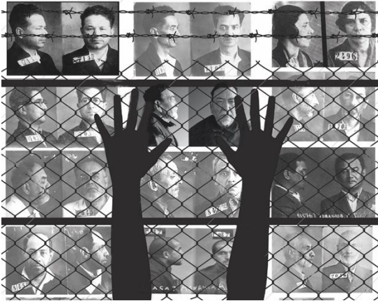
Repressiya qurbanı olmuş Birinci Ümumittifaq Türkologiya Qurultayı iştirakçılarından bəziləri.