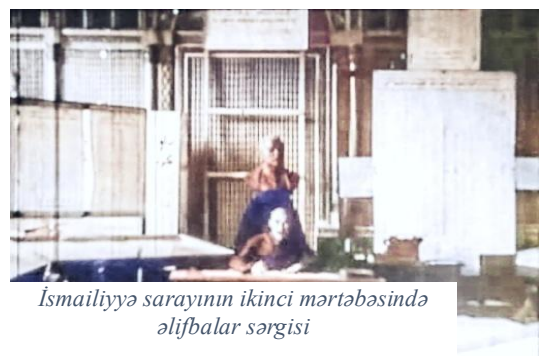
İsmailiyyə sarayının ikinci mərtəbəsində əlifbalar sərgisi

Komissarlığının beş illik maarif sərgisinə və bu kimi digər mühüm elmi və mədəni sərgilərə sonrakı illərdə nəşr olunmuş kitablarda, elmi məqalələrdə və təqdim olunan məruzələrdə ya ümumiyyətlə toxunulmamış, ya da bir neçə cümlə ilə üstündən keçilmişdir. Latın qrafikalı və islah