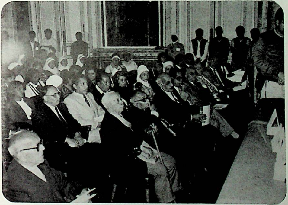
جموع الأساتذة وكبار الشخصيات والسفراء والطلبة والطالبات الذين حضروا جلسات الندوة.